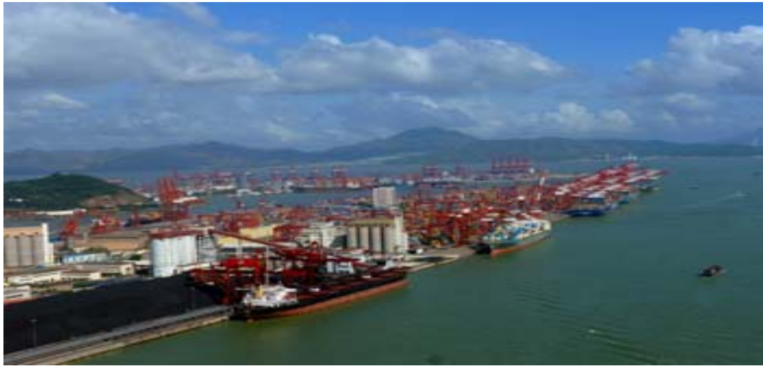
(图为赤湾集装箱码头赤湾港区和妈湾港区)

深圳海岸线全长约 257.3 公里，其中东部 156.7 公里、西部 100.6 公里。根据规划，深圳港口岸线将达 66.9 公里，可形成码头及临港工业岸线 81.8 公里，其中深水岸线 54.8 公里。目前已开发利用(含部分在建工程)的港口岸线长约 35.1 公里、形成码头及临港工业岸线 52 公里、其中深水岸线 38.5 公里。